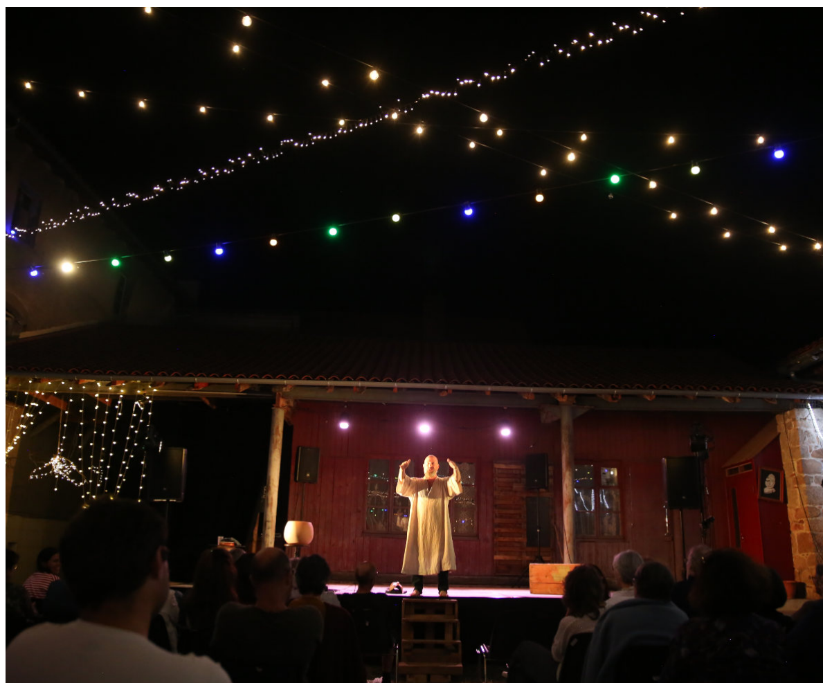
Photo couverture : Didier Monge - Autres photos : Yann Slama, et Stéphane Plumais en avant-dernière page - Graphisme : Aurélie Vilette

Avec le soutien du Théâtre de la Noue et de la Cie Les Ouvriers de Joie.